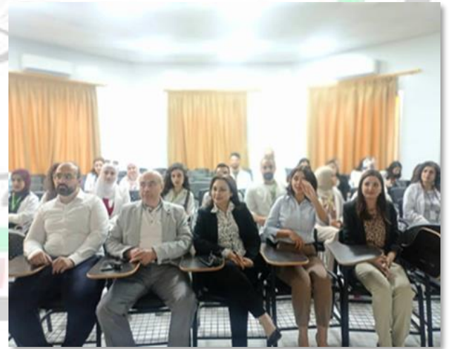
الجلسة العلمية الأسبوعية لطلاب الدراسات العليا في قسم العينية