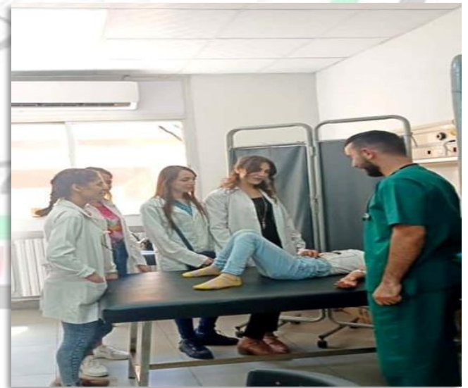
التدريب السريري في مستشفى جامعة البعث