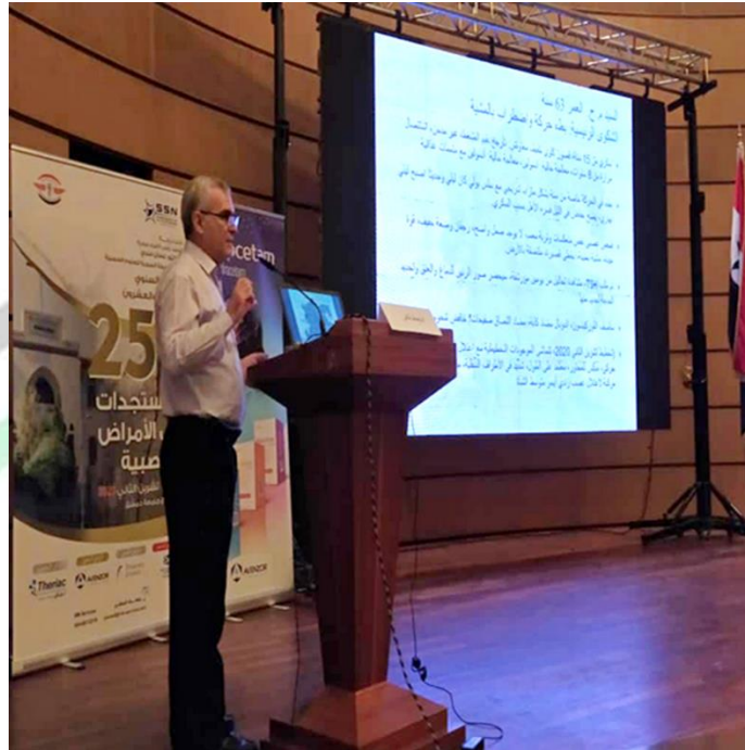
المؤتمر السنوي الخامس و العشرون للرابطة السورية للأمراض العصبية 2023