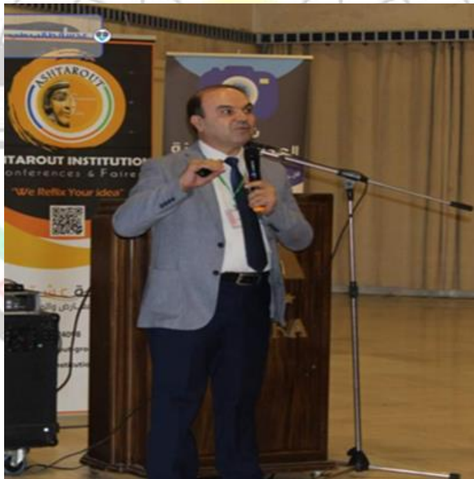
المؤتمر العلمي الدولي التاسع عشر للجمعية السورية للمولدين والنسائيين 2023