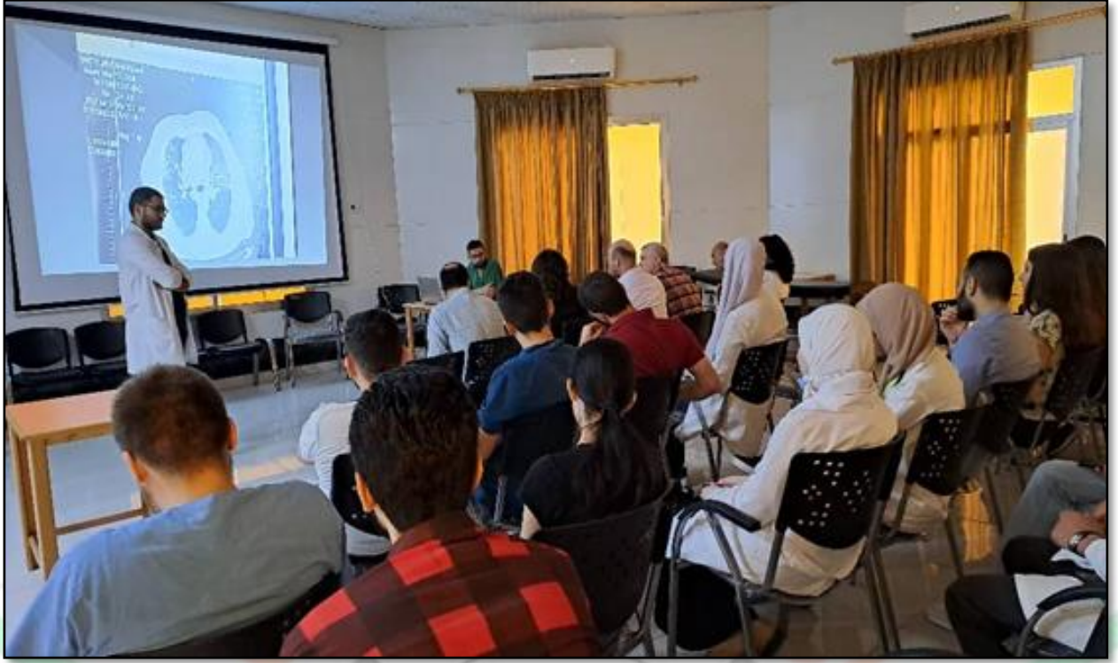
الجلسة العلمية الأسبوعية لطلاب الدراسات العليا في قسم الأمراض الباطنة