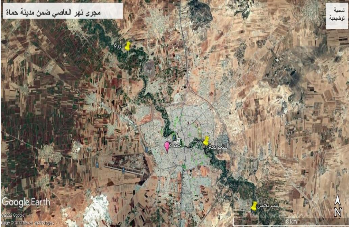
الشكل (1) صورة فضائية لمنطقة الدراسة

الكافات التي تضم ملوثات بشرية آتية من سلمية وتل الدرة والكافات، إضافة إلى أحواض الأسماك وأيضاً منصرفات النشاط البشري والسكني لمدينة حماه ومنصرفات الطرق العامة وبالإضافة إلى منصرفات الشركة العامة لصناعة الحديد وكافة النشاطات الصناعية المتوضعة جنوب المدينة.