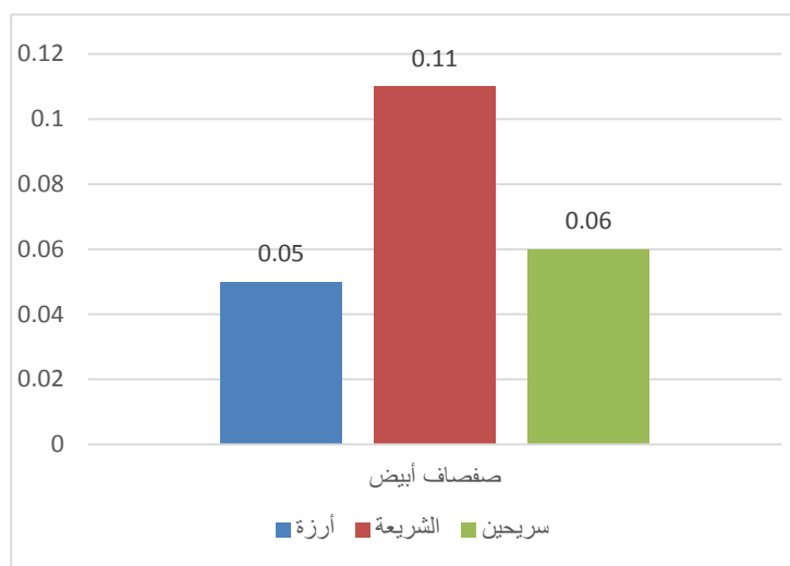
الشكل (3): قيم معامل التركيز الحيوي BF

وأما بالنسبة لمعامل الانتقال TF حيث يلاحظ من الشكل (4) أن معامل الانتقال للرصاص في الصفصاف الأبيض كان أقل من 1 وهذا بدوره يدل على أن حركة المعدن ضعيفة ضمن النبات والذي قد يفسر ارتفاع نسبته في الجذور مقارنة بالأوراق [2]